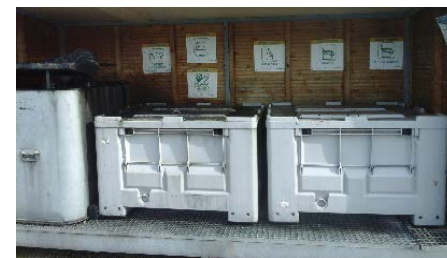
Bacs de tri