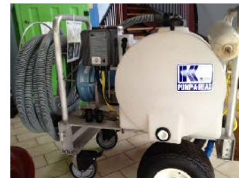
Pompe à eaux noires