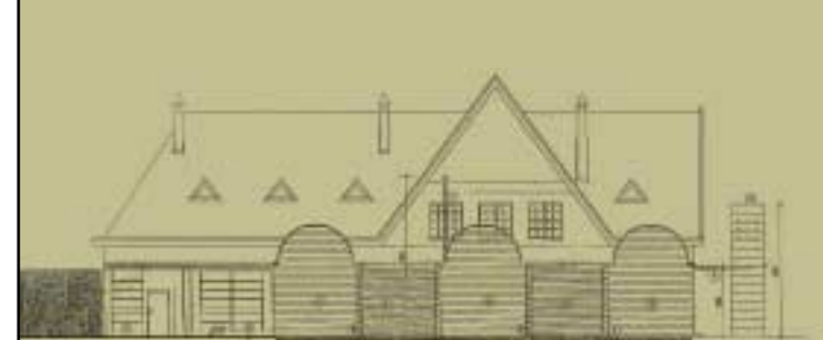
Projet de façade arrière

Internet mode d'emploi Connectez-vous grâce à une carte spécifique, commercialisée sur place (au tarif de 2,50 €). C'est elle qui décompte automatiquement votre temps d'accès internet. L'heure de connexion est facturée 2,50 €. Chaque poste est également équipé d'une imprimante couleur et noir/blanc (0,20 € la feuille).